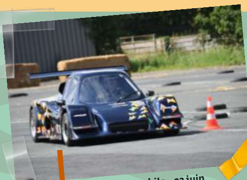
Slalom automobile – 23 juin