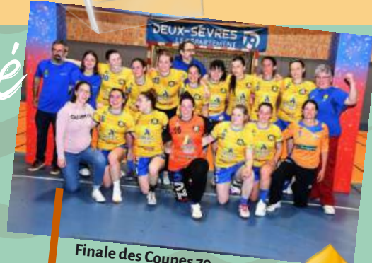
Finale des Coupes 79 Handball – 8 juin