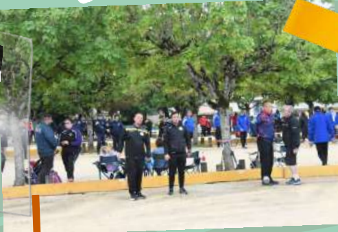
Tournoi de Pétanque – 9 juin