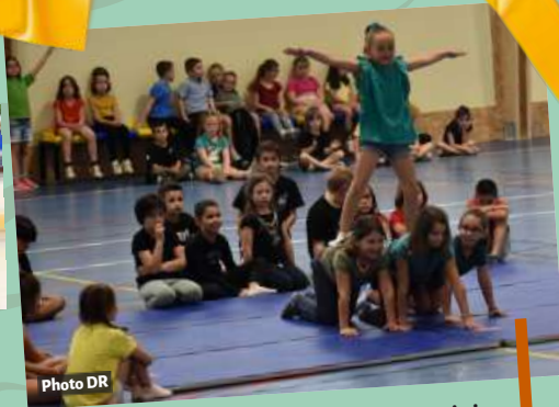
Fête des écoles – 22 juin