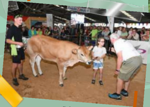
Foire agricole – 8-9 juin