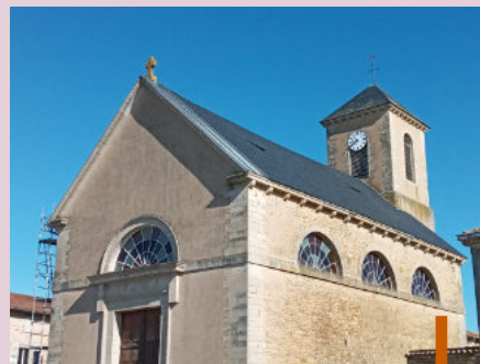
Les travaux de réfection de la toiture de l'église ont été réalisés par l'entreprise Bruno Agnès.