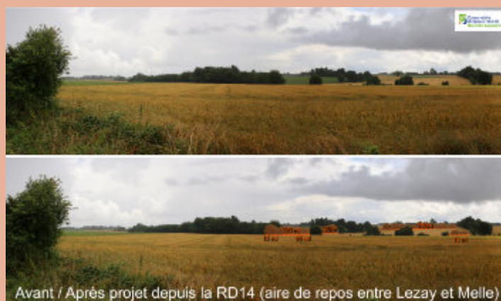
Avant / Après projet depuis la RD14 (aire de repos entre Lezay et Melle)

Le projet a donc consisté en la plantation de 416 ml de haies multistrates en végétaux d'espèces locales (en partenariat avec Samuel Fichet de l'association Prom'haies) sur des parcelles privatives pour limiter le ruissellement des eaux sur le vallon alimentant la Fontaine de la Brassière et son ruisseau.