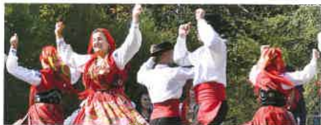
■ La fête des traditions a accueilli un groupe folklorique de Carreço (Portugal) dimanche 19 août dans le parc Honoré Canon.