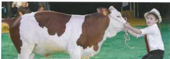
■ Fectiv'agri : concours national de belle ampleur avec cette année un open show génisses de race Prim'Holstein (7-9 juin).