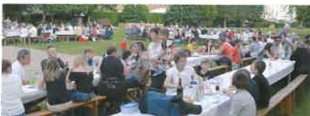
■ Fête du 14 juillet réussie avec une météo favorable pour profiter des animations dans le parc, du pique-nique en musique et du feu d'artifice après la retraite aux flambeaux.