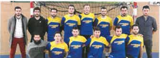
■ Suite à ses victoires de la saison 2017-18, l'équipe masculine de handball évolue désormais en Nationale 3.