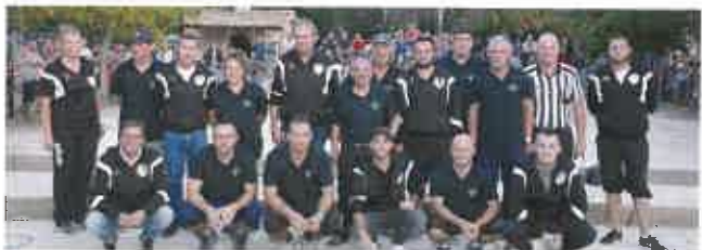
■ Jeudi 20 septembre, concours de pétanque à Lezay dont l'équipe a été battue par Oléron qui évolue au niveau national.