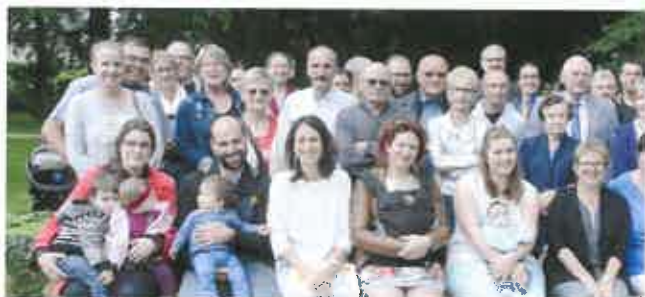
■ Fête des nouveaux arrivants (50 nouveaux foyers) et des 15 bébés de l'année dans le parc Honoré Canon (16 juin).