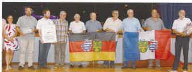
■ Visite à Lezay de nos amis allemands de Barver pour une semaine du 22 au 28 juillet. La soirée officielle a été l'occasion d'échanger discours et cadeaux pour les 40 ans du jumelage.