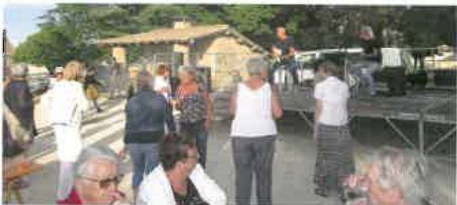
■ Belle réussite pour la 2 ème édition de la fête de la Saint-Jean avec des prestations musicales appréciées (23 juin).